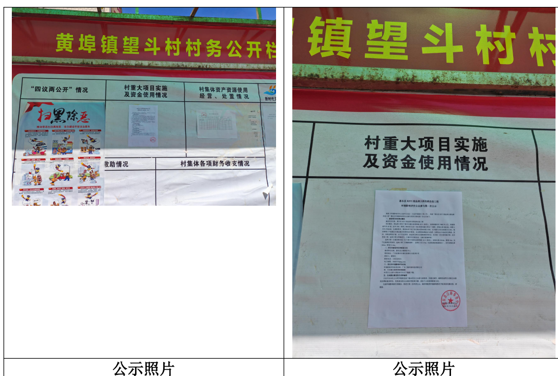
图 3.2-3 本项目张贴告示照片

本次征求意见稿公示，除了在网络和报纸进行公示外，还在项目附近的望斗村村委进行了公告张贴，张贴时间为 2023年5月12日-2023年5月25日，张贴照片见图 3.2-3 所示。公示张贴区域主要为项目附近黄埠镇望斗村宣传栏，符合《环境影响评价公众参与办法》（生态环境部令部令 第 4 号）的要求。